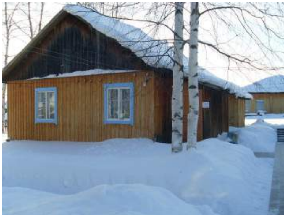
Берёзовская основная школа.