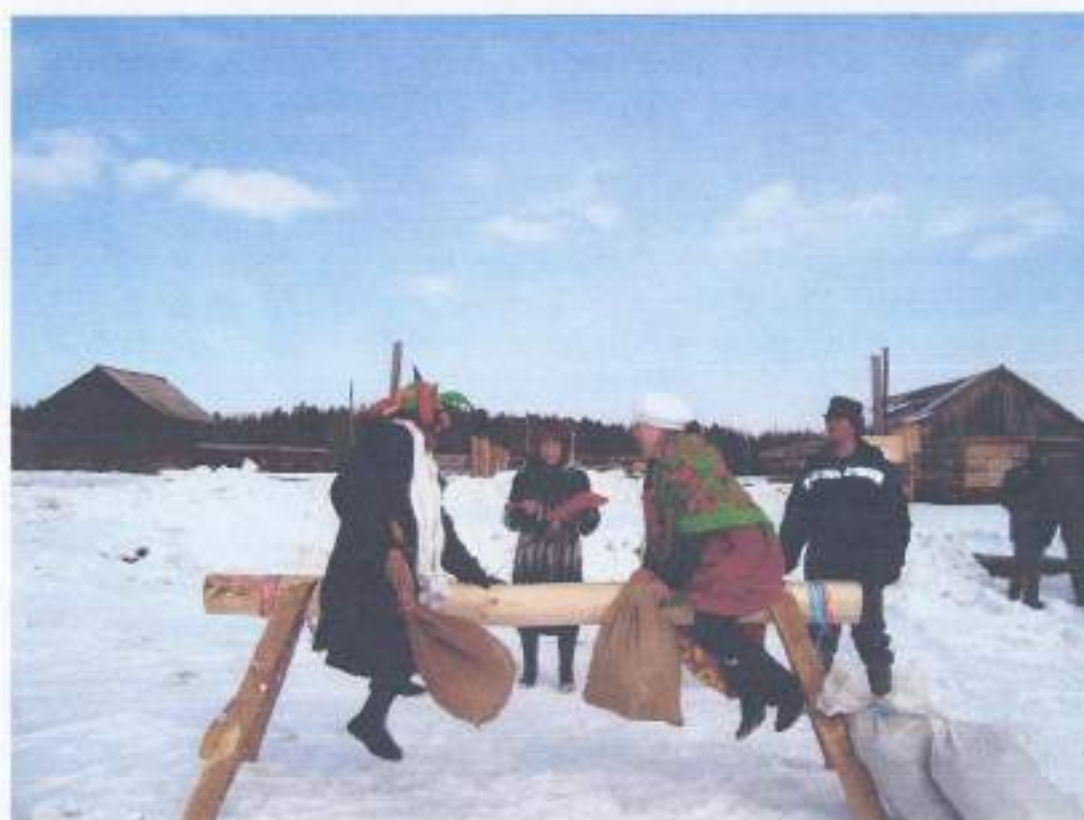
Встреча Весны в с. Берёзовка 2011 год .