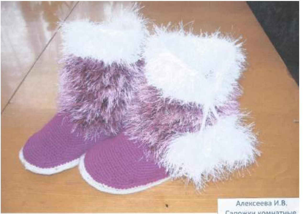
Алексеева И.В. Сапожки комнатные.