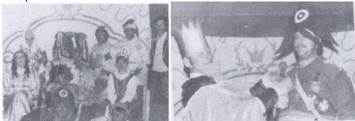
«Сказ про Федота стрельца удалого молодца» - постановка 1986 года

Молодёжь оставалась на селе, после учебы возвращались специалистами обратно. Жизнь на селе была ключом. Молодежь, отработав на ферме и на поле, вечерами все собирались в Доме культуры, ставили спектакли, выезжали в другие деревни с концертами.