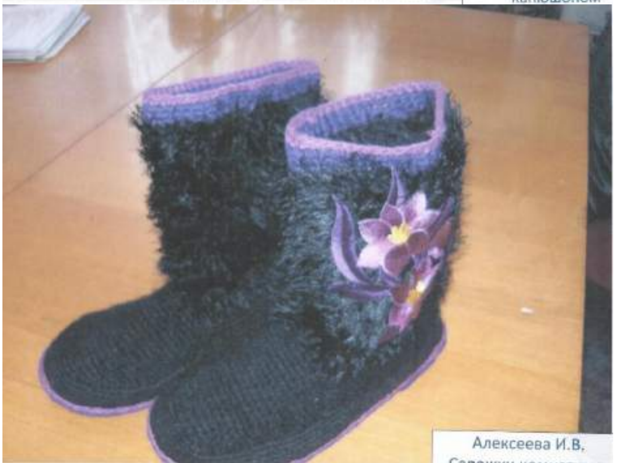
Алексеева И.В. Сапожки комнатные.