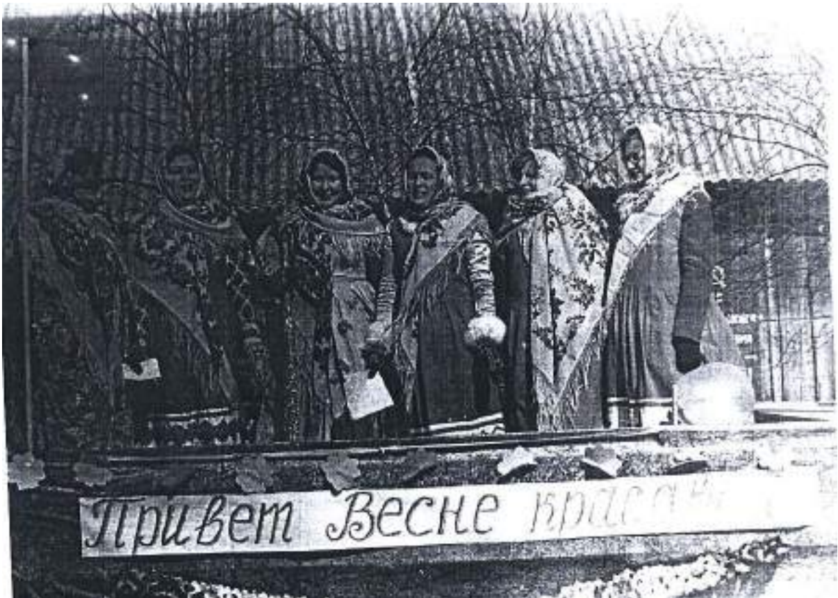
Встреча Весны 1983 год.