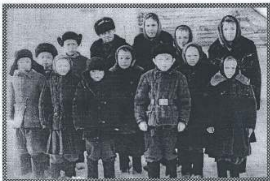
1-4 классы п. Усть-Чурулька 1962 год

В 1957 году семья переехала в Усть-Чурульку Каргасокского района. Учились дети с 4 класса в Усть-Чижанской школе и жили в интернате народов Севера. Школа находилась в ста километрах от дома, досхать можно было только на лошадях. Домой дети приезжали только на зимние и летние каникулы.