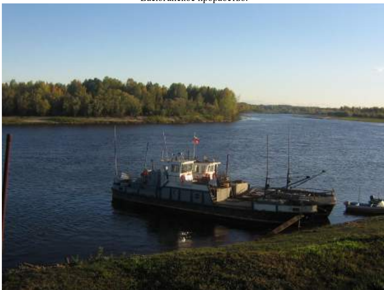
Теплоход «Сириус» Занимается перевозкой водным путем.