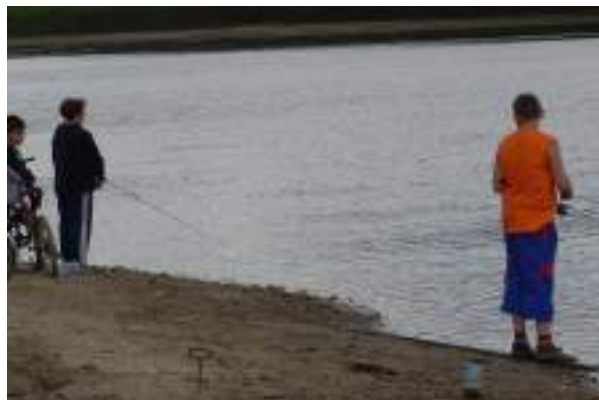
После рыбалки варим уху.