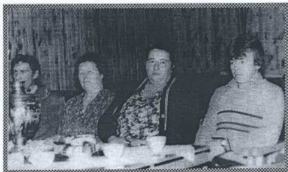
Березовский Дом культуры, напутственное слово будущим защитника Отечества, с. Старая Березовка, ноябрь 1988 года